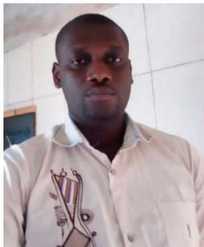
Par Ben Diom (Abidjan)

Il ne s'agit pas pour moi de jeter la pierre dans le jardin de qui que ce soit. Ce dont il est question, c'est de dire la vérité divine sur un sujet donné en éclairant les zones d'ombre par la lumière du saint Coran et des hadiths authentiques qui ne sauraient contredire, en aucune façon, le Kitâbal-Lah (le Livre d'Allah). En effet, j'ai été très amusé de voir la mine renfrognée de certains "oulamas" maliens lorsque IBK, à l'ouverture du congrès du Haut Conseil Islamique du Mali qu'il a présidé le 20 avril dernier, a fait le "Tawassoul" (invocation pour demander