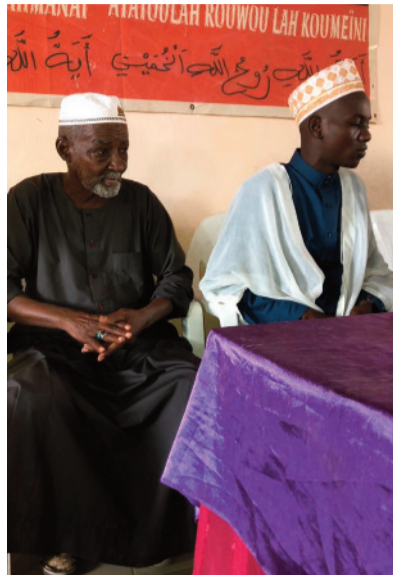
La cérémonie organisée à cet effet dans la Husseiniya «Nâdi Hussein», qui a été ouverte par la lecture du saint Coran par un

En quelques années seulement, la localité a acquis la réputation de citadelle chiite la plus dynamique du Mali. Collée au calendrier musulman duodécimain, elle célèbre ou commémore, en effet, tous les événements majeurs liés à l'histoire de la famille du Prophète Mouhammad (sawas). La dernière occasion en date sur ce registre était la fête du 15 Sha'aban 1440H (21 avril 2019). Une occasion opportune qui a été saisie pour rappeler aux fidèles l'indispensable nécessité de reconnaître les Ahlou Bayt (as) comme les successeurs authentiques et légitimes du dernier des Messagers d'Allah, le Prophète Mouhammad (sawas), mais singulièrement, d'admettre le bien fondé de la réalité du 12ème Imam, al-Mahdi (ajfs) qui gouverne notre temps.