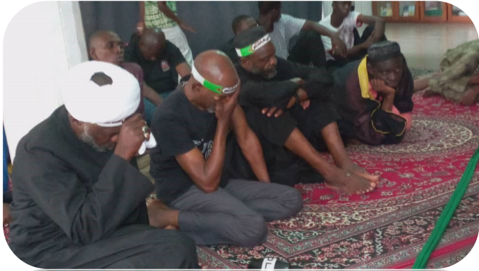
Mosquée imam Hussein de Douala